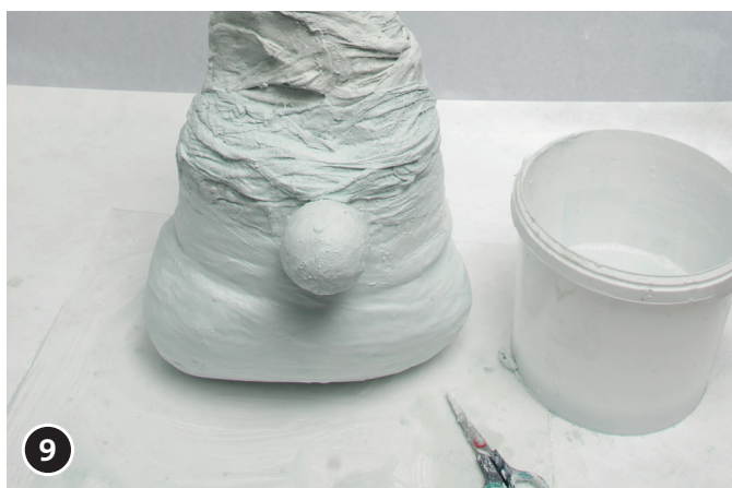
9 Rivestire completamente il cappello di filo con bende per modellaggio. Lasciare asciugare le bende per modellaggio per ca. 1 - 2 giorni.