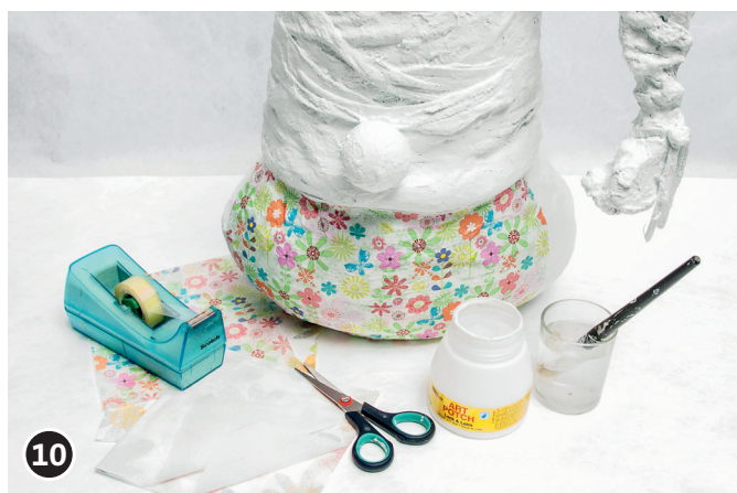
10 Separare lo strato superiore stampato del tovagliolo dai due strati inferiori. Tagliare il tovagliolo nella misura desiderata. (Adattare alla misura del corpo del gnomo). Appoggiare il motivo del tovagliolo (strato superiore) con la parte inferiore sul corpo del gnomo. Partendo dal centro del tovagliolo, spalmare la colla per découpage con il pennello di setola, delicatamente sul tovagliolo. Utilizzare un pennello di setola morbido. Incollare completamente il corpo del gnomo con il tovagliolo. Lasciare asciugare la colla per tutta la notte.