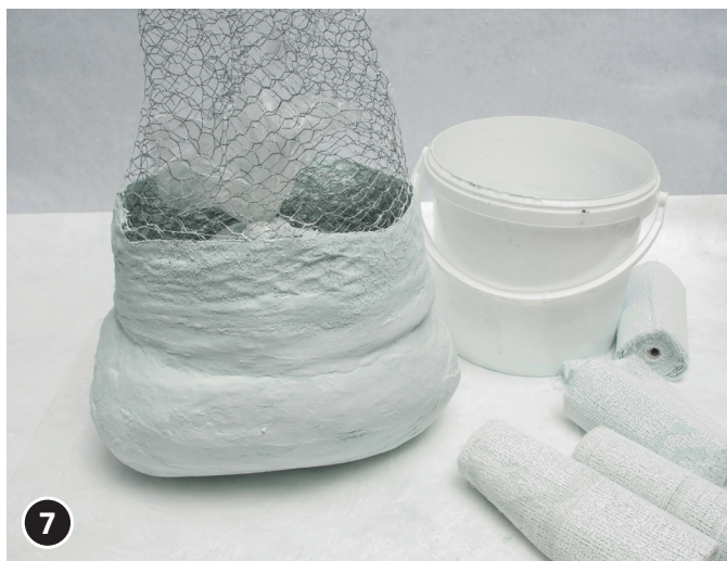
7 Fissare il corpo e il cappello con ulteriori bende per modellaggio.