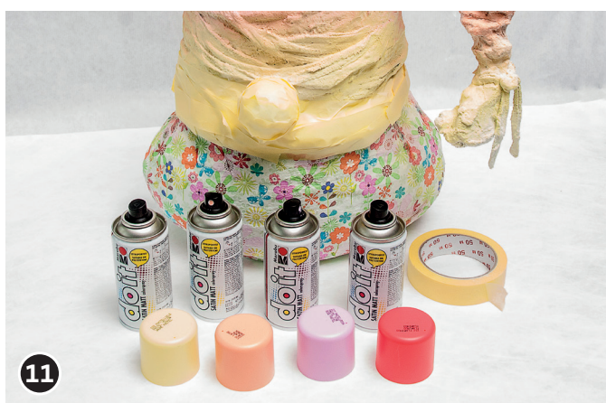
11 Spruzzare del colore sul cappello del gnomo. Lasciare asciugare l'applicazione di colore per tutta la notte.