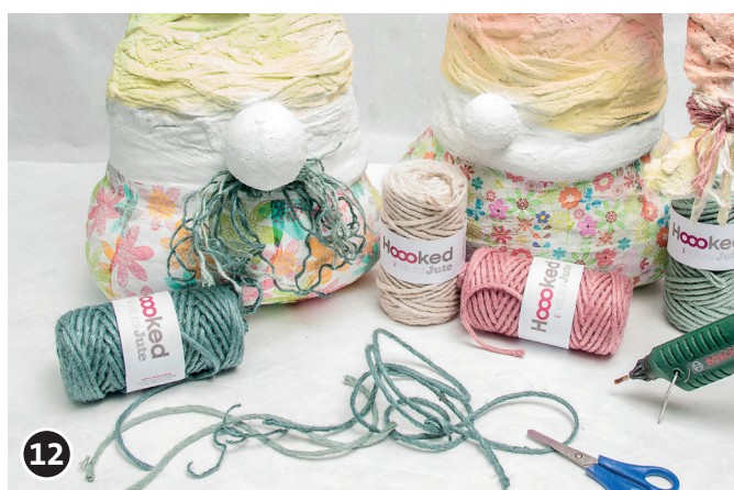
12 Utilizzare del filato di iuta per il cappio e i baffi. Tagliare nella lunghezza desiderata, annodare e fissare eventualmente con la pistola a caldo (oppure colla da bricolage).

Buon divertimento nella realizzazione ti augura il tuo team creativo OPITEC!