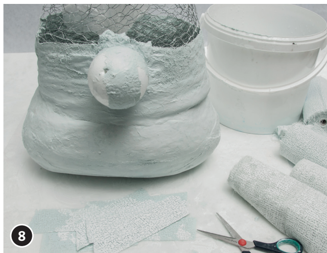
8 Fissare la sfera di polistirolo (naso) con bende per modellaggio al bordo del cappello.